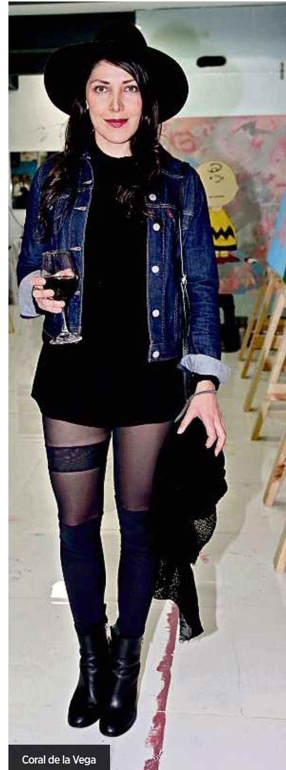
Coral de la Vega